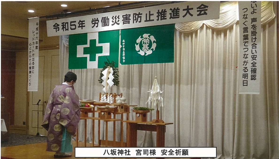
八坂神社 宮司様 安全祈願